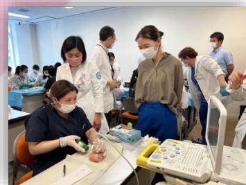
ハンズオンセミナーの様子